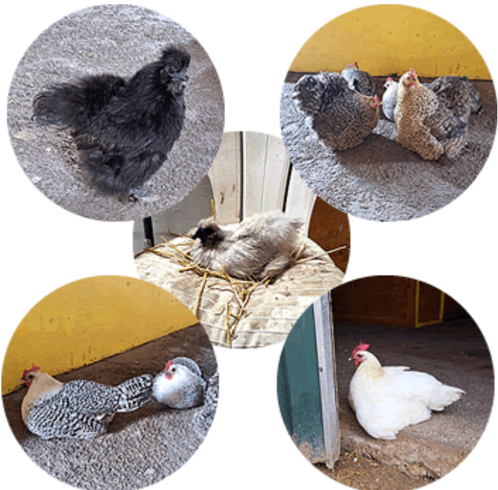
Links boven: zwarte Fluffy. Rechts boven: de Gypsy Girls. Midden: grijze Fluffy. Links onder: de Dames Kievit. Rechts onder: Moeder Overste