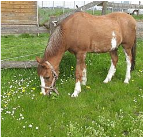
Macho in de wei

Macho is nu degene die hinnikt als welkom wanneer ik door de schuifdeuren naar binnen stap, net als Snuitje vaak deed. Eén keer boog Macho bij het binnenkomen zijn hoofd om - net als hij in het verleden wel deed - onder het touw door te stappen op het grindpad dat naar de parkeerplaats leidt. Maar toen aarzelde hij en trok zijn hoofd terug. Alsof hij zich realiseerde dat Snuitje daar niet meer was... Dat was aandoenlijk om te zien. Onze kleine weduwnaar doet het goed. Gelukkig! Iedere avond krijgt hij extra aandacht met een aai over zijn neus en krabbels door zijn manen en daar geniet hij duidelijk van. In de vorige Nieuwsbrief van maart stond dat onze dieren de winter in goede gezondheid waren doorgekomen. In het voorjaar verwacht je geen ziektes, die komen veel vaker in herfst of winter voor. Maar de avond dat de Nieuwsbrief werd verzonden was Pomar ziek... Hij at zijn Subli en kuil niet, stond heel stilletjes op stal. De dierenarts kwam. Pomar had koorts, hoge koorts. Een temperatuur van 39.6 graden (de normale lichaamstemperatuur van een paard komt overeen met die van een mens en ligt rond de 37 graden). Pomar kreeg koortsremmers die twee keer per dag moesten worden toegediend.