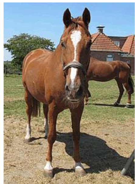
Nirvana, weer gezond!

In de vorige Nieuwsbrief van maart stond dat onze dieren de winter in goede gezondheid waren doorgekomen. In het